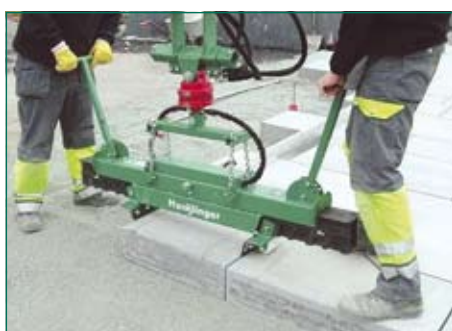
выдержка равных зазоров