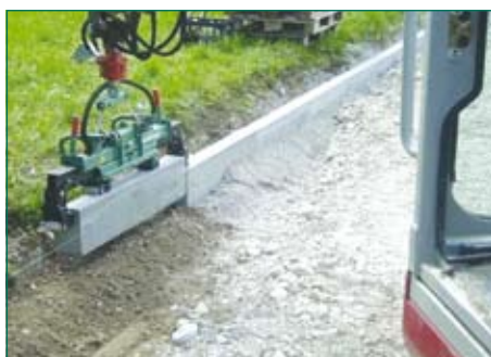
один рабочий может укладывать бордюры