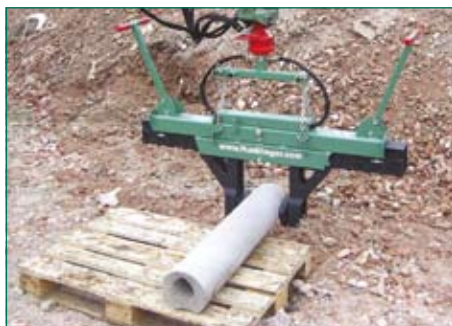
зажим изделия в гор. положении