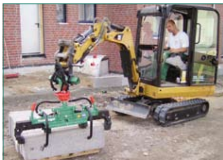
установка без зазора