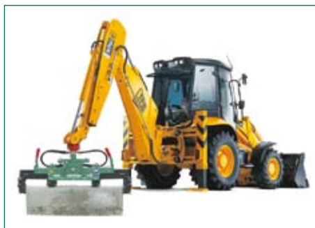
погрузчик с обратной лопатой