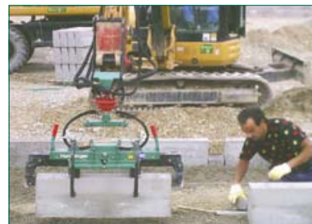
установка по шнуру