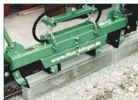
установка бордюров по линии

Большой запас по грузоподъёмности. Большая производительность по сравнению с ручным трудом.