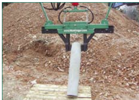
вращение до вертикали