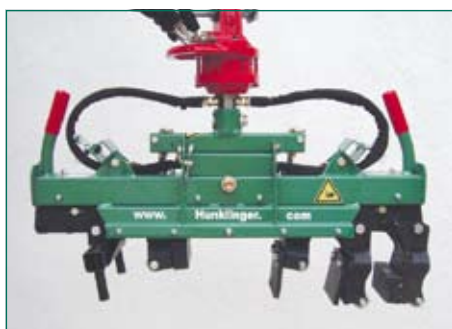
различные виды зажимов