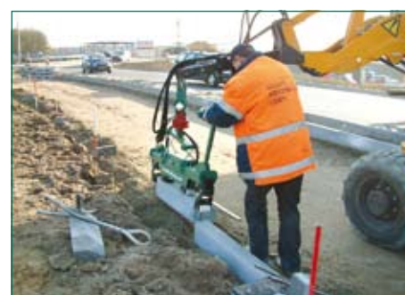
установка дорожных бордюров

Этот универсальный захват находит применение во многих областях . Все чувствительные части защищены рамой. Регулируемый подвес обеспечивает укладку на наклонной поверхности