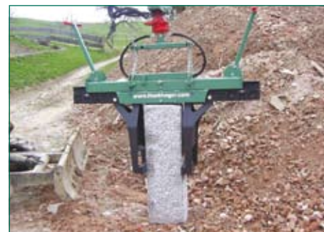
зажим крупных изделий