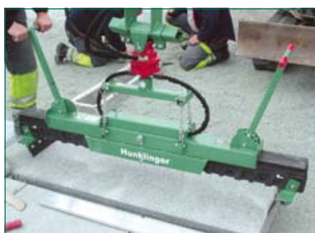
укладка тяжелых блоков